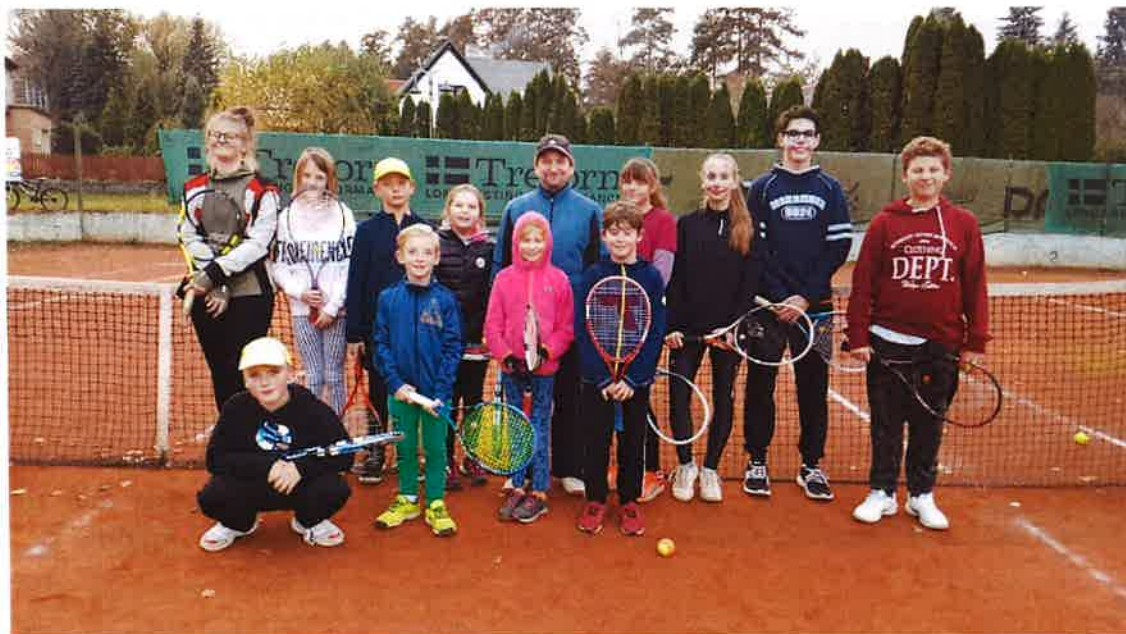
Foto: trénink a halloween